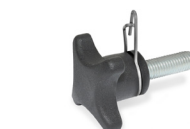
GN 6335.4 → Seite 587 GN 6335.5 → Seite 587 Werkstoff ST