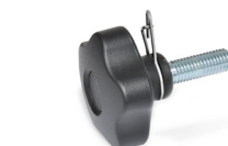
GN 5337.2 → Seite 561 GN 5337.7 → Seite QVX Gr. 32 ... 63