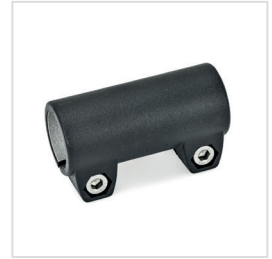
3 Kennziffer 2 mit 2 Edelstahl-Zylinderschrauben DIN 912