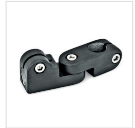
3 Kennziffer 2 mit 3 Edelstahl-Zylinderschrauben DIN 912