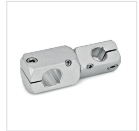
Klemmhebelset GN 511