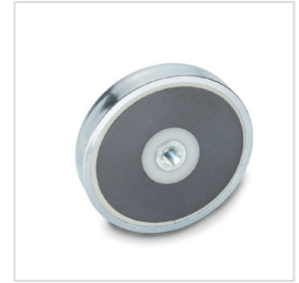
Ansicht auf Haftfläche