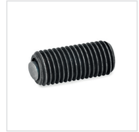
Anwendungsbeispiel verschiedener Pendelelemente mit O-Ring