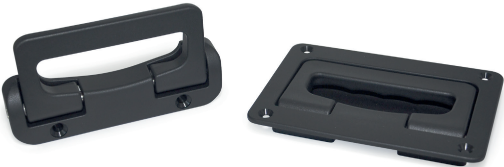
Schalen-Klappgriff GN 825.2 Klappgriff GN 825.1 → Seite XYZ